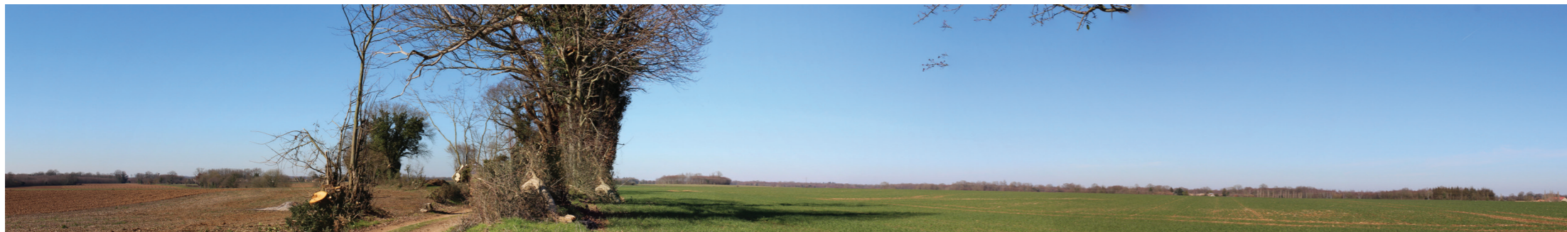
Vue panoramique de l'état initial (angle de vue 120°)