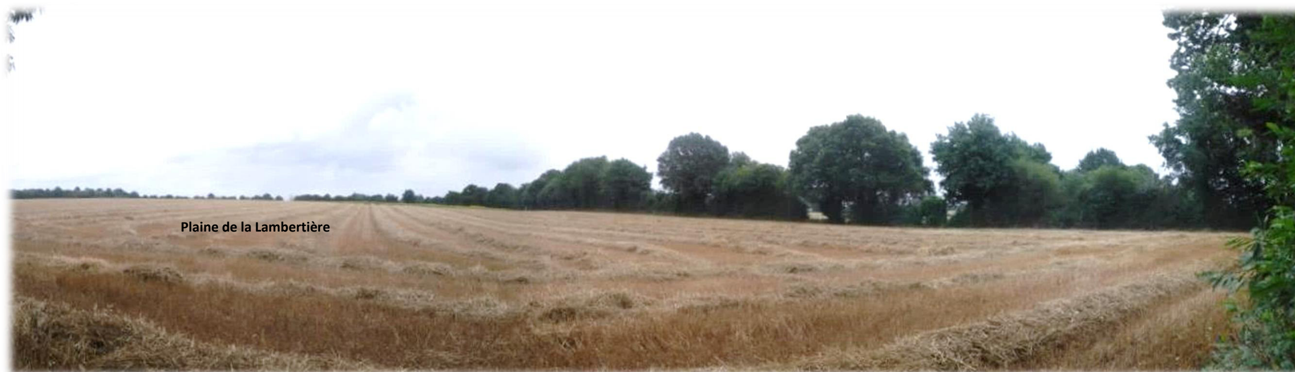
Vue 2 : Vue panoramique depuis le sud-ouest de la ZIP la plus à l'est, en direction de l'est, vers la « Plaine de la Lambertière ».