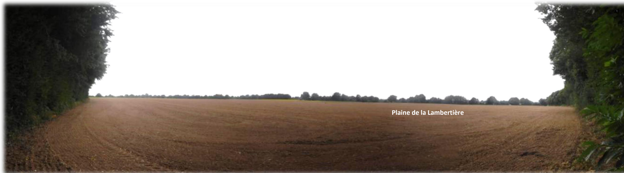
Vue 1 : Vue panoramique depuis le centre de la ZIP la plus à l'est, en direction du sud-est, vers la « Plaine de la Lambertière ».