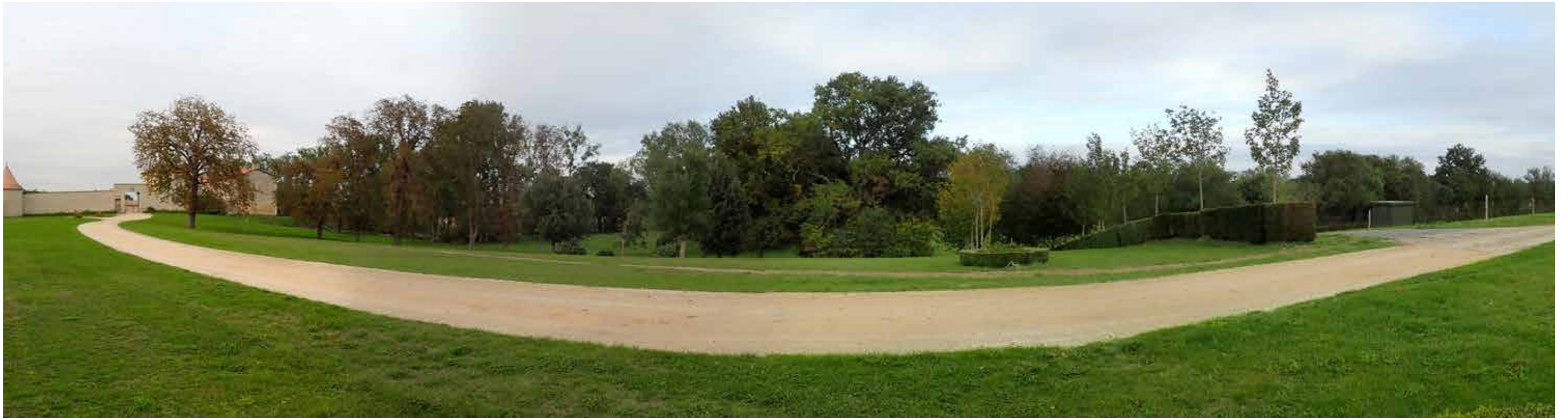
PHOTO 137 : VUE EN DIRECTION DU PROJET POTENTIEL DEPUIS LE NORD DU DOMAINE