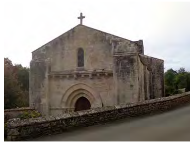
PHOTO 132 : FAÇADES NORD DE L'ÉGLISE SAINT-ROMAIN