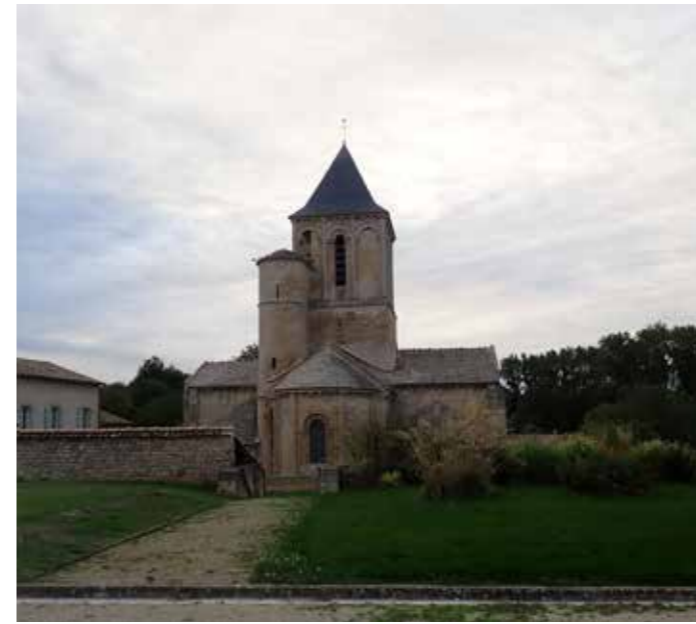
PHOTO 129 : ENTRÉE EST DE L'ÉGLISE SAINT-MAIXENT