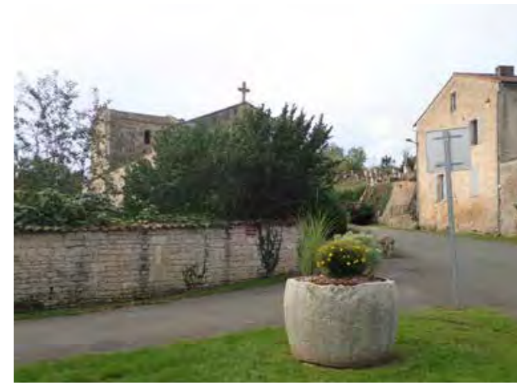
PHOTO 133 : ÉGLISE SAINT-ROMAIN DEPUIS LA PLACE NORD

Degré d'ouverture sur le paysage : L'église Saint-Romain se situe dans le centre-bourg de Saint-Romans-lès-Melle. Depuis la place au nord, elle se dissimule dans un écrin de verdure, dans le fond de la vallée de la Béronne. Le monument historique se situe hors ZVI et donc le relief et la trame bâtie, masquent les vues en direction de la ZIP.