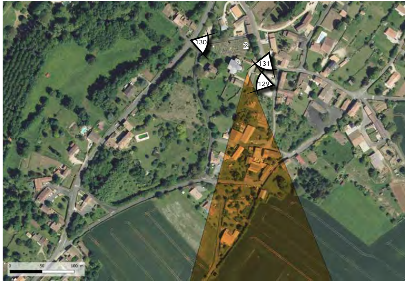
FIGURE 80 : LOCALISATION DU MONUMENT HISTORIQUE SUR FOND BD ORTHO (© AGENCE COÛASNON)