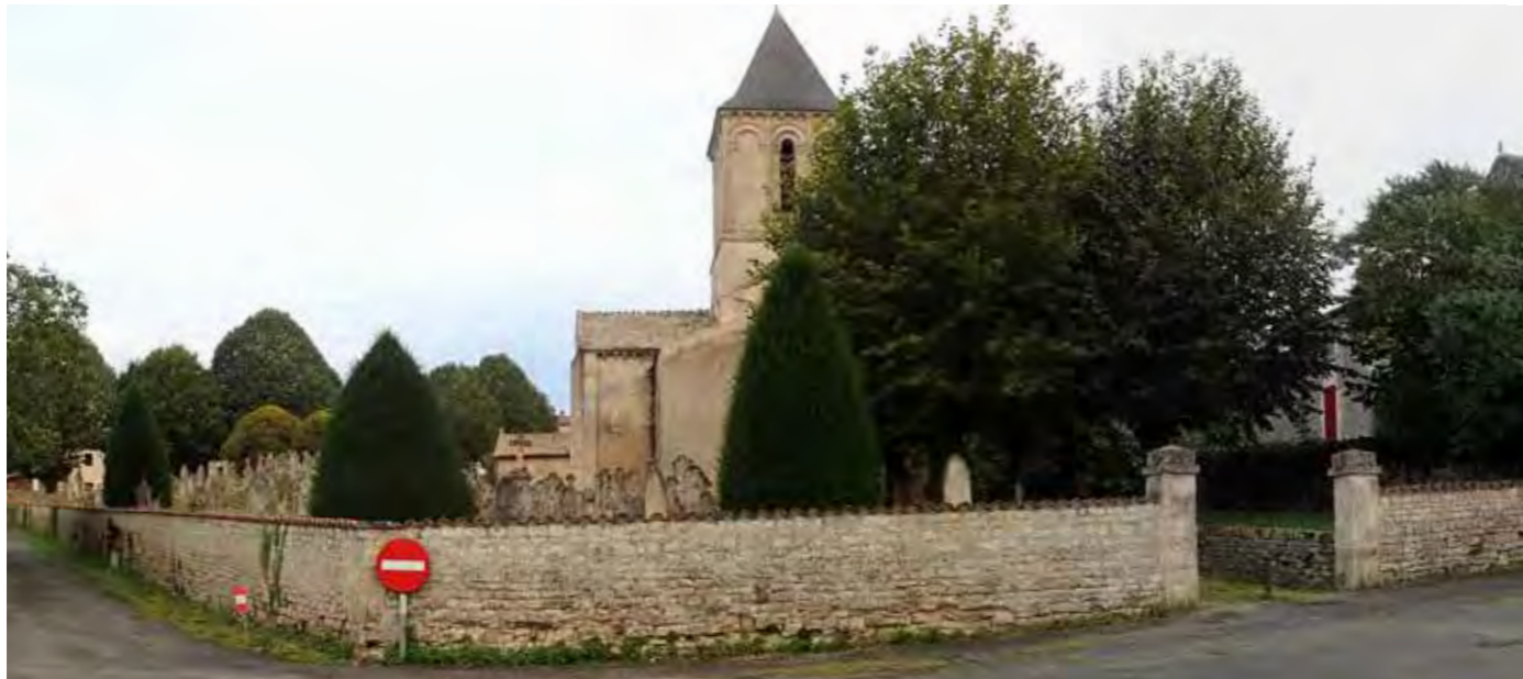
PHOTO 141 : CIMETIÈRE AU NORD DE L'ÉGLISE SAINT MAIXENT

Degré d'ouverture sur le paysage : Le site du cimetière de Verrines-sous-Celles se situe en centre-bourg au pied de l'église Saint-Maixent. La trame bâtie et la végétation ferment les vues sur la ZIP.