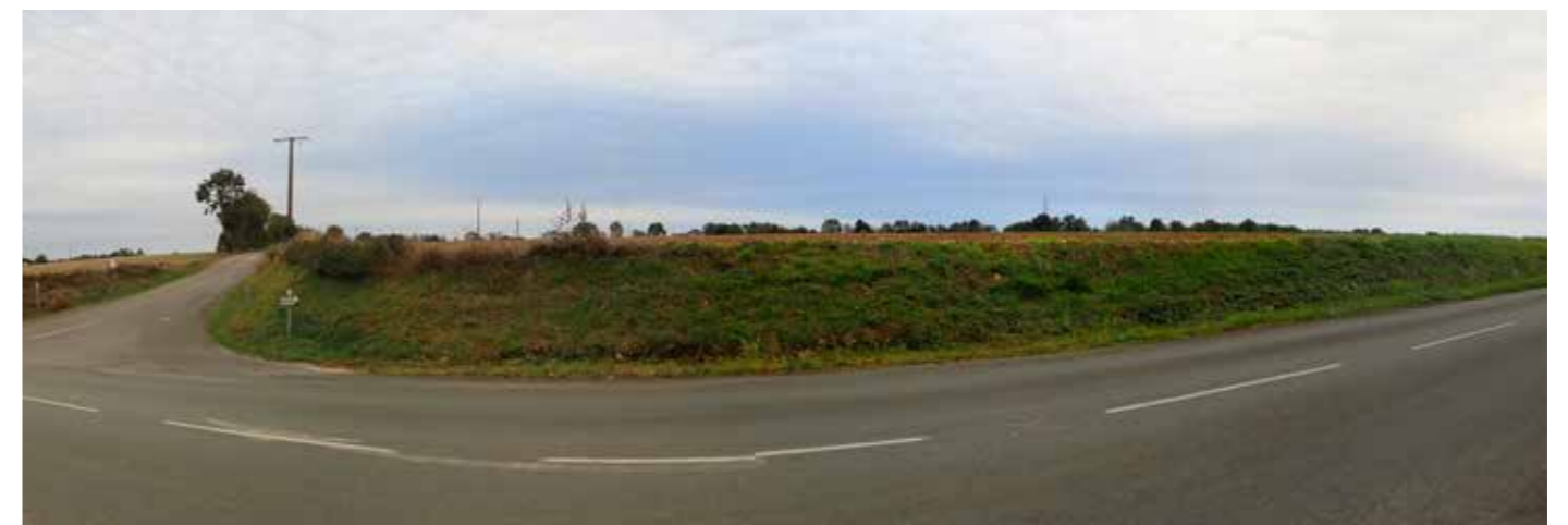
PHOTO 140 : VUE TRONQUÉE PAR LE RELIEF ET LA TRAME VÉGÉTALE DEPUIS LA FRANGE SUD DU SPR DE VERRINES-SOUS-CELLES