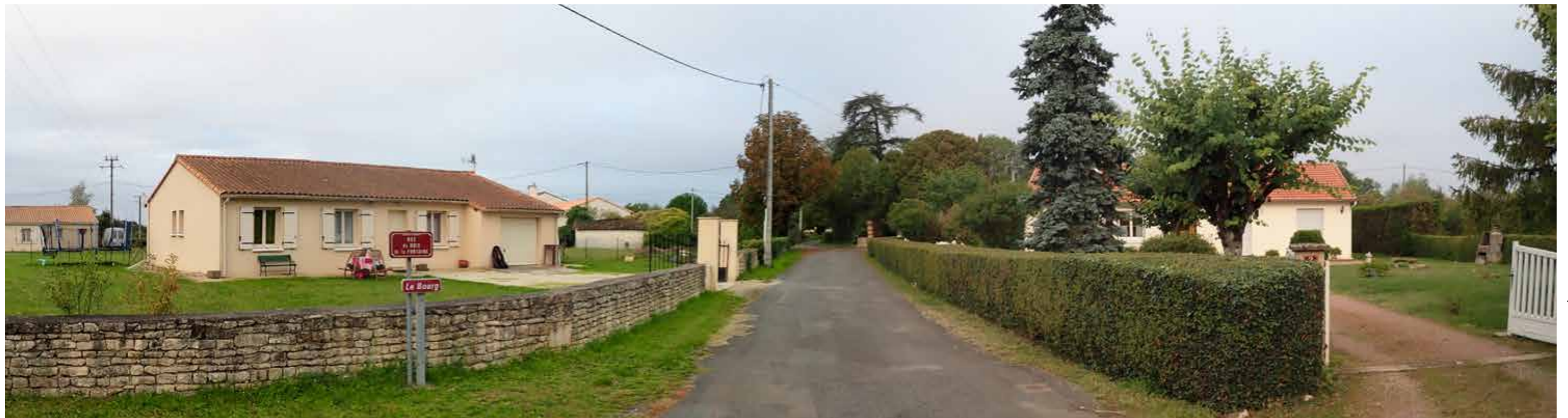
PHOTO 135 : VUE EN DIRECTION DE LA ZIP À PROXIMITÉ DE LA CURE DE MAZIÈRES-SUR-BÉRONNE