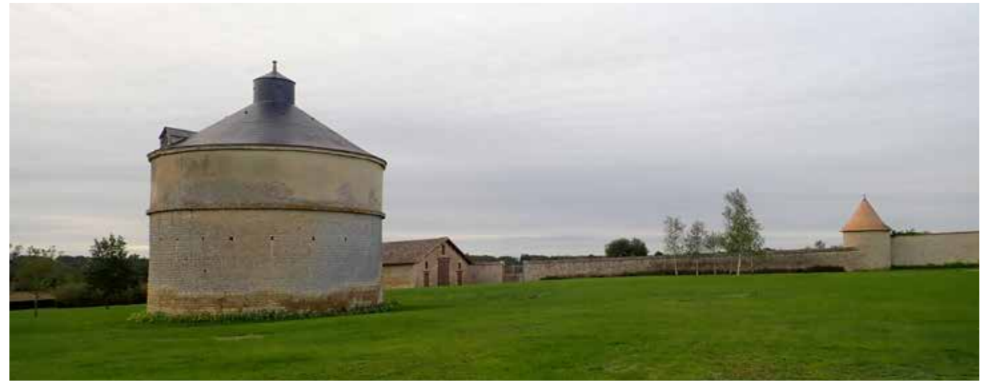
PHOTO 136 : FAÇADES NORD DU DOMAINE DE GRAND PORT

Degré d'ouverture sur le paysage : Le domaine de Grand Port se situe à proximité d'un vallon au milieu de parcelles cultivées. Les vues en direction de la ZIP sont tronquées et filtrées par la végétation du vallon présent entre le domaine du Grand Port et la ZIP.