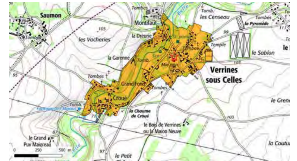
FIGURE 87 : LOCALISATION DU SPR SUR FOND IGN