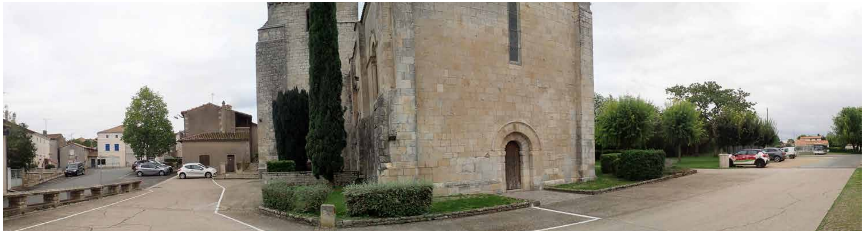
PHOTO 128 : VUE EN DIRECTION DU PROJET POTENTIEL DEPUIS LE NORD DE L'ÉGLISE