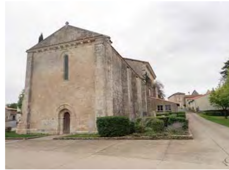
PHOTO 127 : FAÇADES OUEST ET SUD DE L'ÉGLISE SAINT-MARTIN

Degré d'ouverture sur le paysage : L'église Saint-Martin est située dans le centre-bourg de Périgné. De par son implantation dans la vallée de la Belle, le relief et la trame bâtie tronquent les vues sur la ZIP. Cette dernière étant située à moins d'un kilomètre du village de Périgné, la prégnance visuelle est importante.