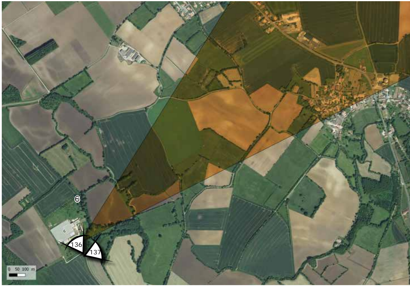
FIGURE 84 : LOCALISATION DU MONUMENT HISTORIQUE SUR FOND BD ORTHO (© AGENCE COÛASNON)