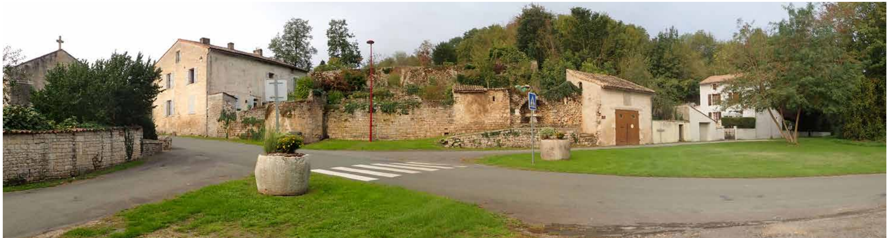
PHOTO 134 : VUE EN DIRECTION DU PROJET POTENTIEL DEPUIS LE NORD DE L'ÉGLISE