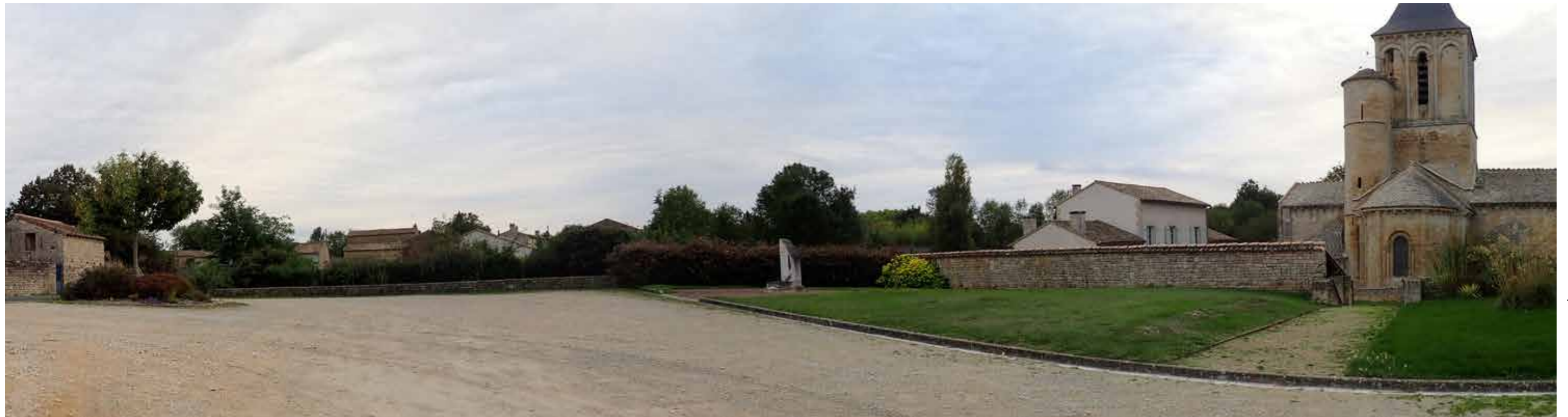
PHOTO 131 : VUE EN DIRECTION DE LA ZIP DEPUIS LA PLACE DE L'ÉGLISE À L'EST