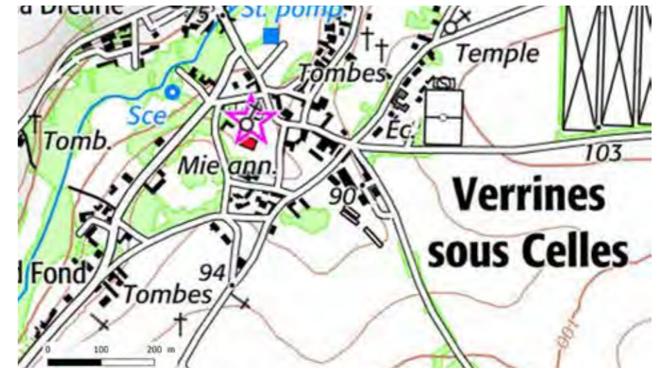
FIGURE 89 : LOCALISATION DU SITE PROTÉGÉ SUR FOND IGN

L'aire immédiate compte un site protégé qui fait l'objet d'une analyse ci-après.