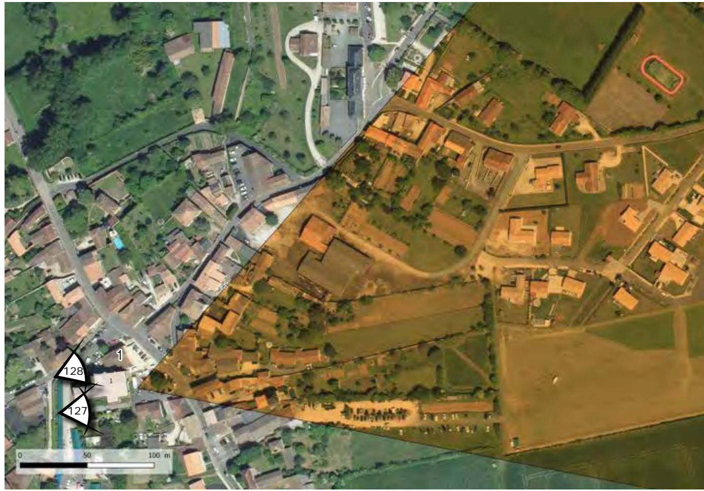
FIGURE 79 : LOCALISATION DU MONUMENT HISTORIQUE SUR FOND BD ORTHO