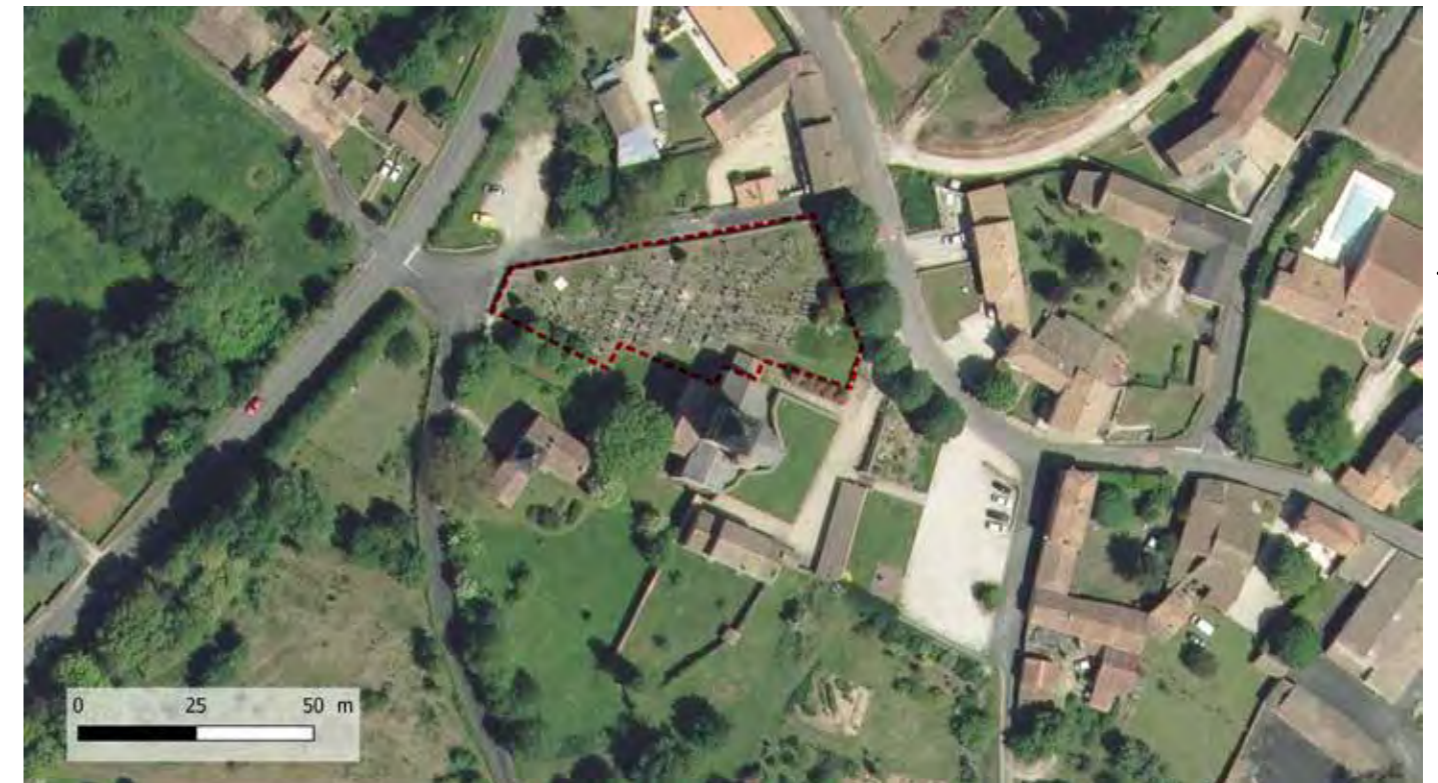
FIGURE 90 : LOCALISATION DU SITE PROTÉGÉ SUR FOND ORTHO