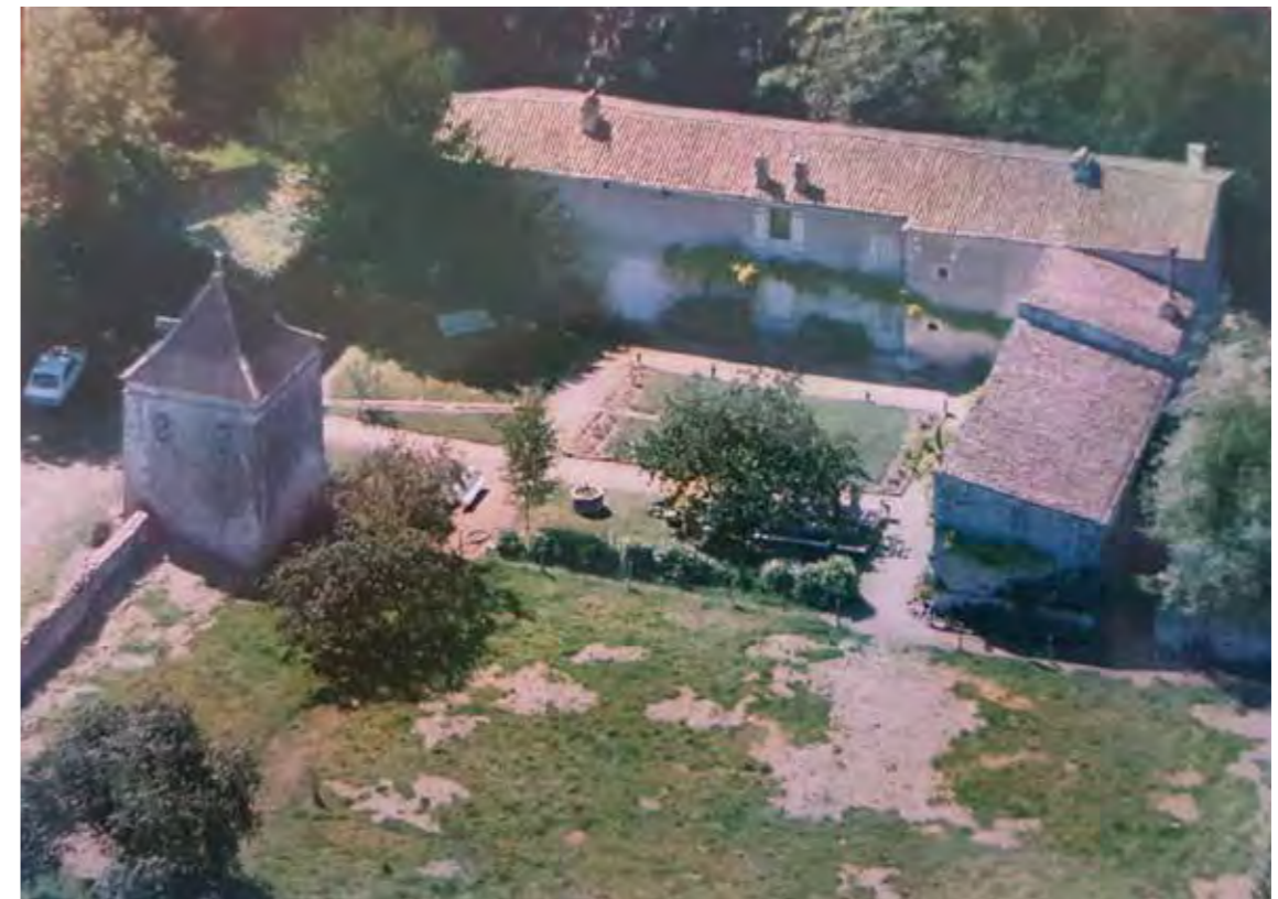
FIGURE 83 : PHOTOGRAPHIE AÉRIENNE ANCIENNE DE LA CURE DE MAZIÈRE-SUR-BÉRONNE

Degré d'ouverture sur le paysage : La cure de Mazières-sur-Béronne se trouve dans le fond de la vallée de la Béronne. Elle est composée de l'ancienne église Notre-Dame ainsi qu'un système hydraulique comprenant les sources, les bassins, les fontaines et les canalisations. De par son implantation dans le creux de la vallée et sa faible hauteur elle n'est pas visible depuis le village de Mazières-sur-béronne. Aucune sensibilité n'est donc relevée.