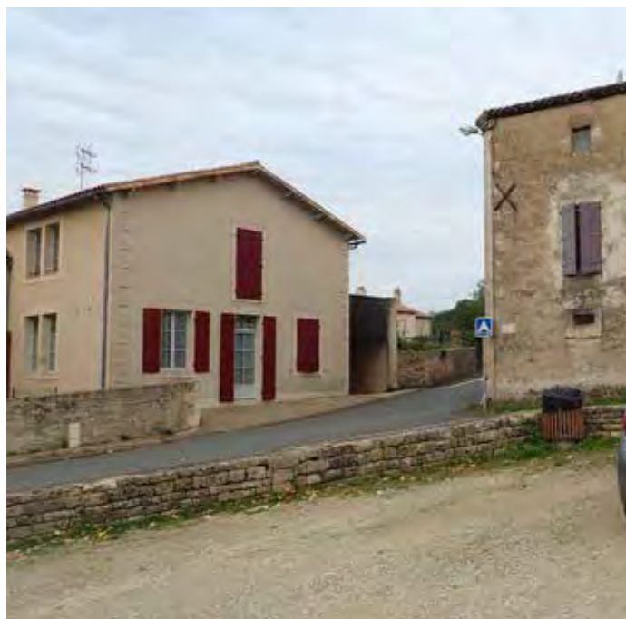
PHOTO 138 : CENTRE-BOURG DE VERRINES-SOUS-CELLES