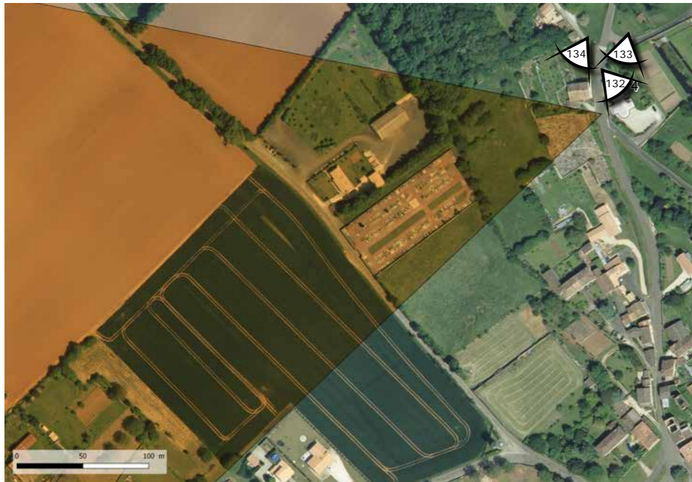
FIGURE 81 : LOCALISATION DU MONUMENT HISTORIQUE SUR FOND BD ORTHO