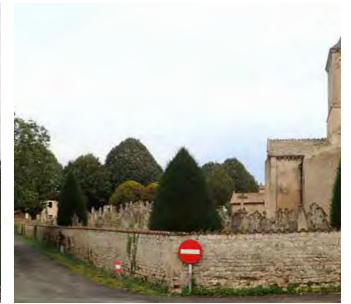
PHOTO 130 : CIMETIÈRE AU NORD DE L'ÉGLISE SAINT-MAIXENT

Degré d'ouverture sur le paysage : L'église Saint-Maixent a été construite dans le centre-bourg de Celles-sur-Belle. Depuis la place à l'est les vues en direction de la ZIP sont tronquées par le tissu bâti et la végétation privative. Étant à 2km du site de projet d'implantation éolien, la ZIP reste visible avec une sensibilité modérée.