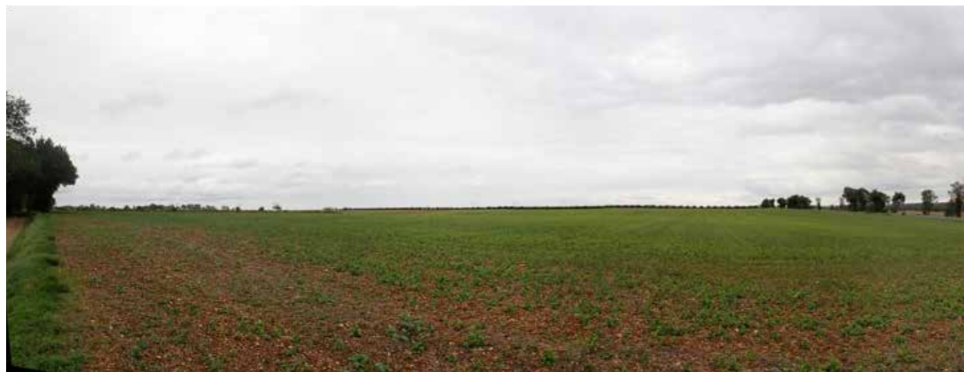
PHOTO 119 : DEPUIS L'HABITAT ISOLÉ DU TEIL LA VUE EST OUVERTE EN DIRECTION DE LA ZIP