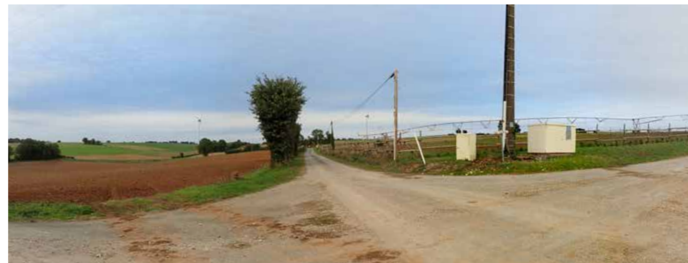
PHOTO 120 : DEPUIS L'HABITAT ISOLÉ DES OULMES, LES VUES SONT FILTRÉES PAR LES HAIES BOCAGÈRES ET LE MATÉRIEL AGRICOLE