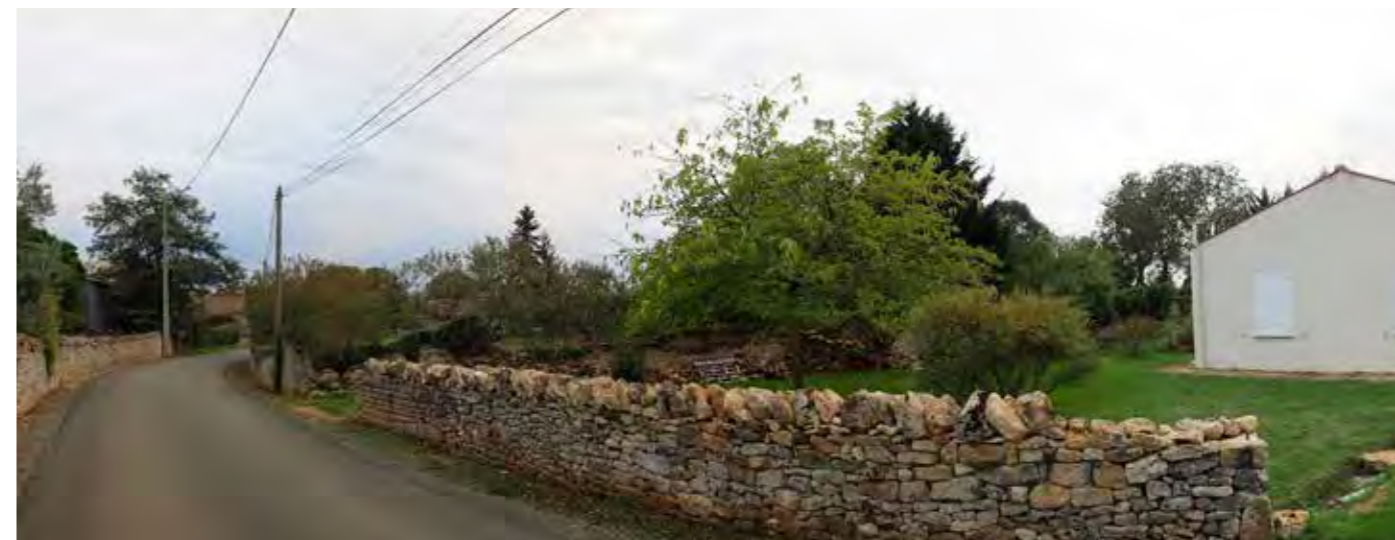
PHOTO 121 : LES VUES SONT ICI TRONQUÉES PAR LE TISSU BÂTI ET LA VÉGÉTATION PRIVATIVE DU HAMEAU DE NEGRESSAUVÉ