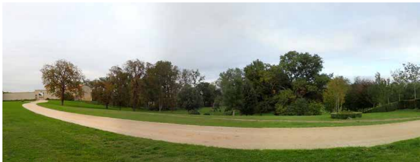
PHOTO 118 : À PROXIMITÉ DE L'HABITAT ISOLÉ DU GRAND PORT (MH) - LES VUES EN DIRECTION DE LA ZIP SONT TRONQUÉES PAR LA VÉGÉTATION D'UN VALLON