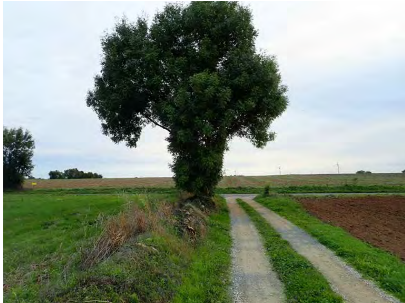
PHOTO 105 : DEPUIS LA FRANGE SUD LES VUES SONT OUVERTES EN DIRECTION DE LA ZIP