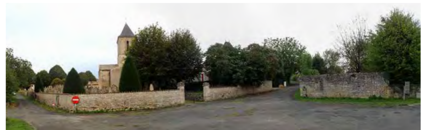
PHOTO 104 : DEPUIS LE CENTRE-BOURG DE VERRINES-SOUS-CELLES, LES VUES EN DIRECTION DE LA ZIP SONT TRONQUÉES PAR LA TRAME BÂTIE ET LA VÉGÉTATION