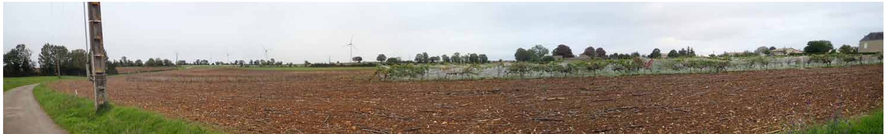
PHOTO 112 : DEPUIS LA FRANGE OUEST D'ÉTROCHON, LES VUES EN DIRECTION DE LA ZIP SONT OUVERTES