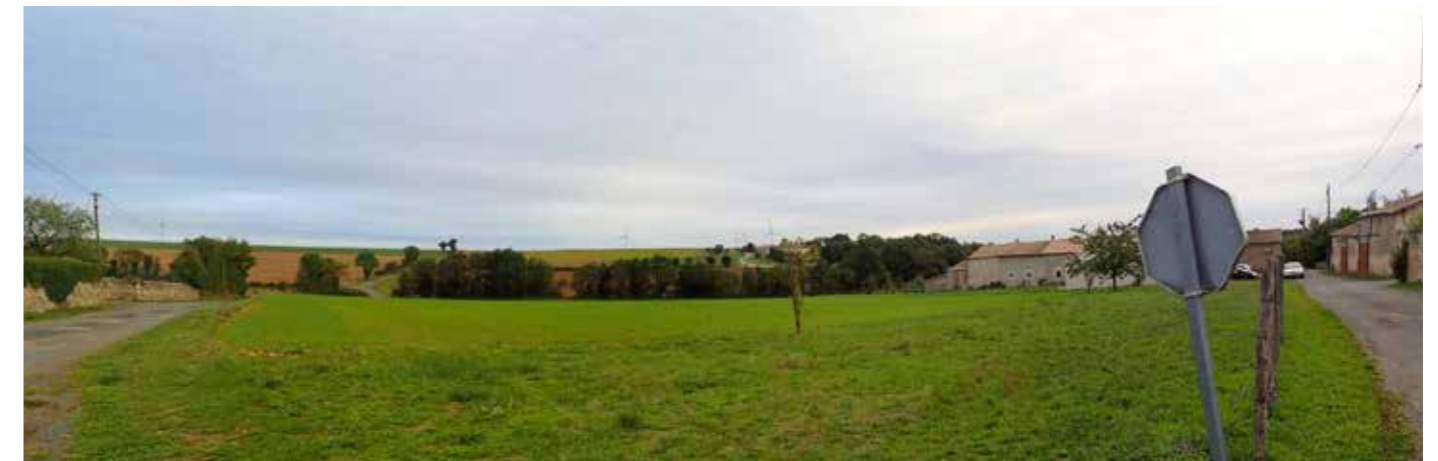
PHOTO 99 : LES HABITATIONS SITUÉES À L'EST DU VILLAGE PRÉSENTENT DES VUES OUVERTES SUR LA ZIP