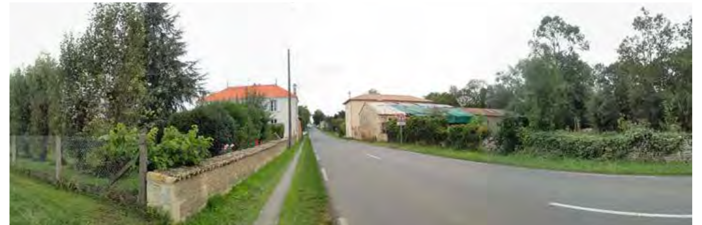
PHOTO 115 : DEPUIS L'ENTRÉE DU BOURG DE VILAINE, LES VUES SONT TRONQUÉES PAR LA TRAME BÂTIE ET LA VÉGÉTATION PRIVATIVE