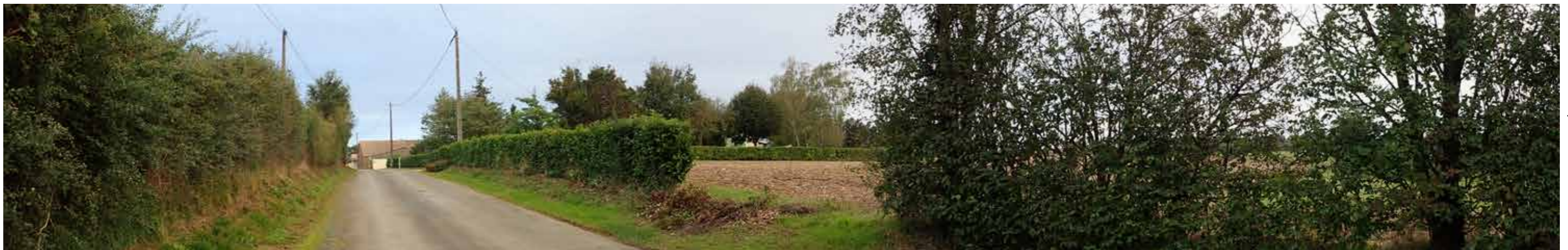
PHOTO 100 : LA SORTIE EST DU VILLAGE OFFRE DES VUES TRONQUÉES OU FILTRÉES PAR LA VÉGÉTATION PRIVATIVE DES HABITATIONS EN DIRECTION DE LA ZIP