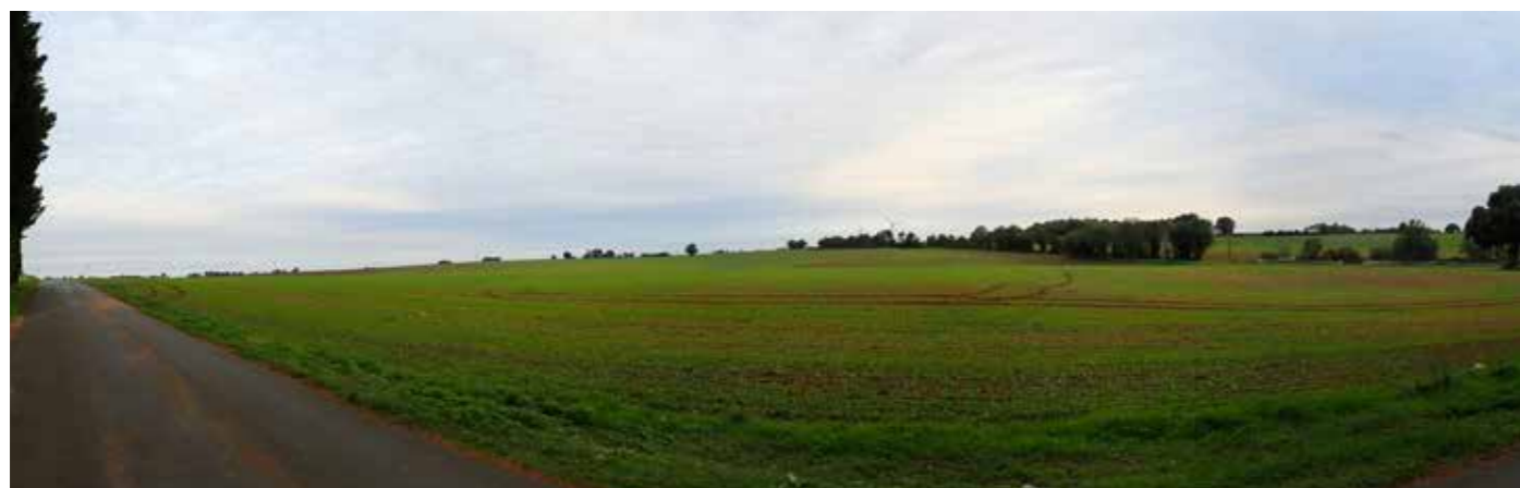
PHOTO 103 : LES VUES DEPUIS LES FRANGES EST SONT OUVERTES VERS LA ZIP