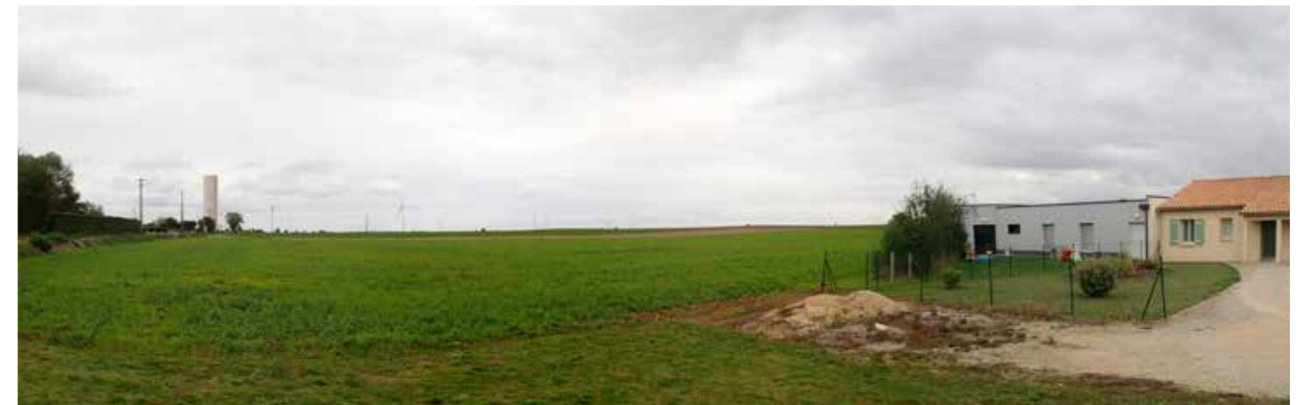
PHOTO 97 : LES VUES DEPUIS LES FRANGES EST SONT OUVERTES VERS LA ZIP