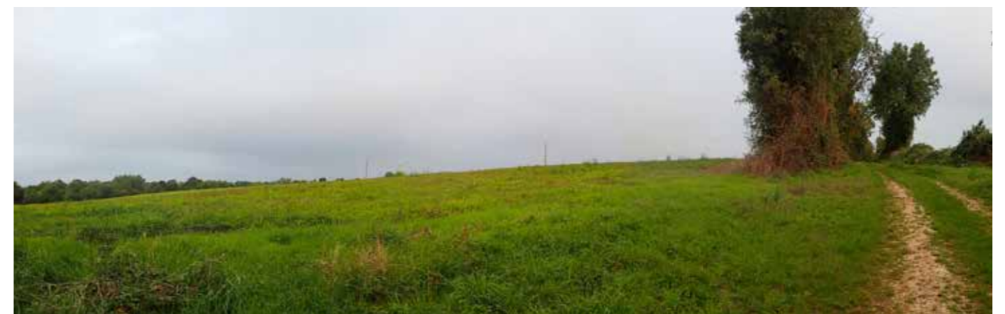
PHOTO 111 : LES VUES DEPUIS LES FRANGES OUEST SONT TRONQUÉES PAR LE RELIEF DE LA VALLÉE DE LA BÉRONNE