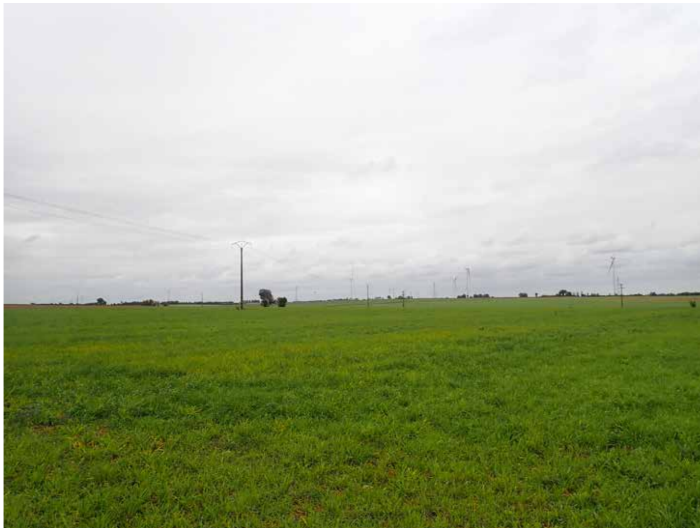
PHOTO 114 : DEPUIS LA FRANGE NORD LES VUES SONT OUVERTES EN DIRECTION DE LA ZIP