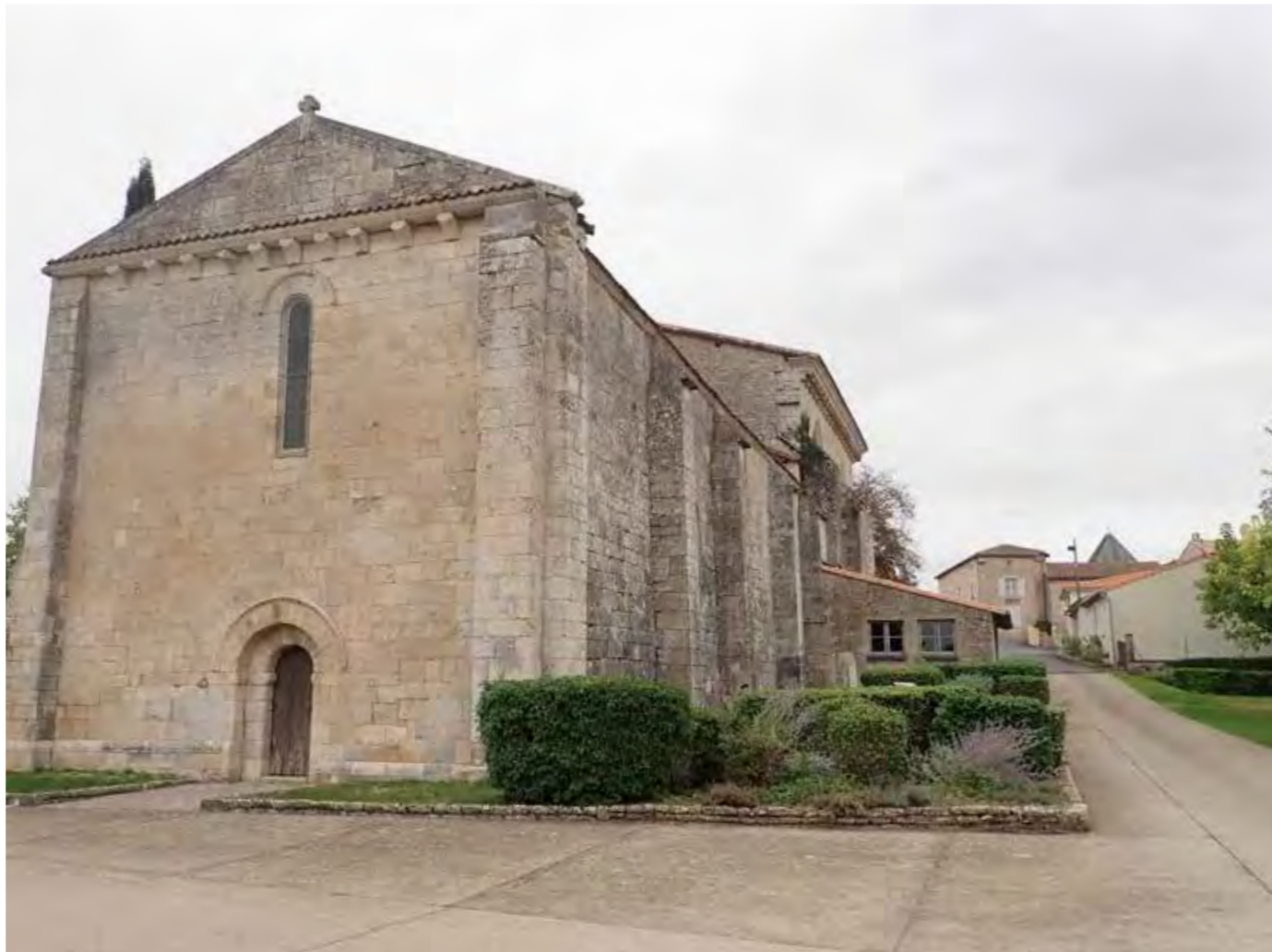
PHOTO 95 : ÉGLISE DE PÉRIGNÉ - LES VUES EN DIRECTION DE LA ZIP SONT MASQUÉES DEPUIS L'ÉGLISE

ÉTUDE D'IMPACT DU PROJET ÉOLIEN DE LA CÉRISIAIE - VOILET PAYSAGER