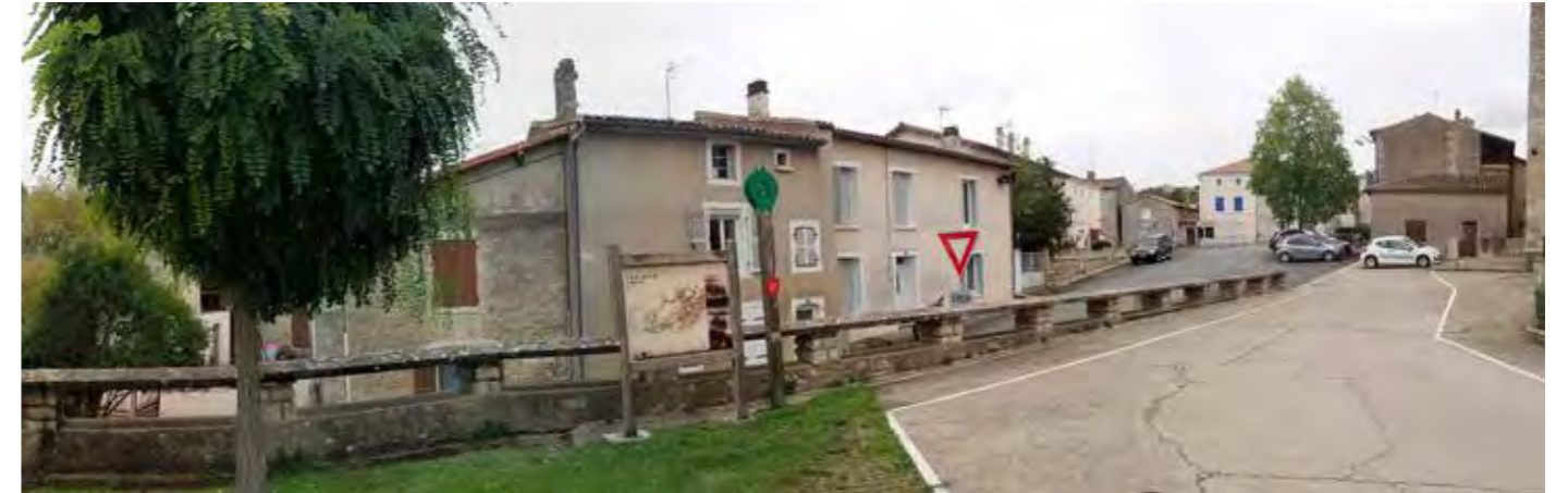
PHOTO 96 : DEPUIS LE CENTRE-BOURG DE PÉRIGNÉ, LES VUES EN DIRECTION DE LA ZIP SONT TRONQUÉES PAR LE RELIEF ET LA TRAME BÂTIE