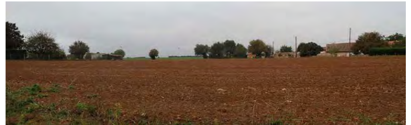
PHOTO 110 : DEPUIS LA FRANGE OUEST DE SAINT-ROMANS-LÈS-MELLE LES VUES EN DIRECTION DE LA ZIP SONT OUVERTES ET PARFOIS FILTRÉES PAR LA VÉGÉTATION ET LA TRAME BÂTIE