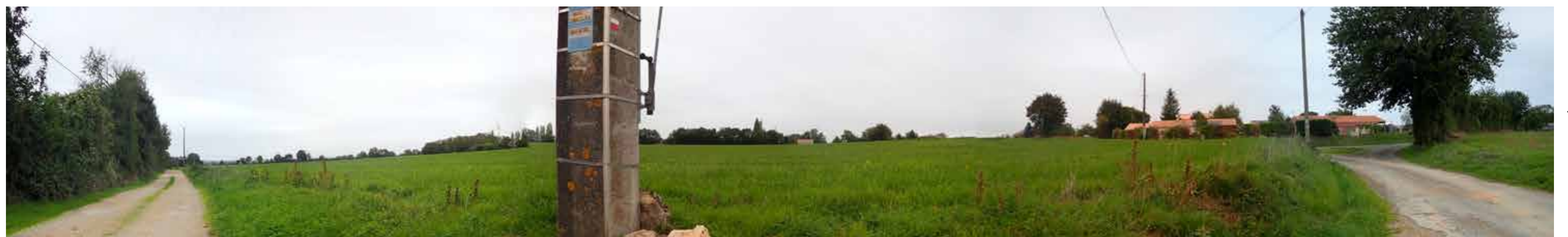
PHOTO 113 : DEPUIS LE SUD D'ÉTROCHON LES VUES EN DIRECTION DE LA ZIP SONT OUVERTES