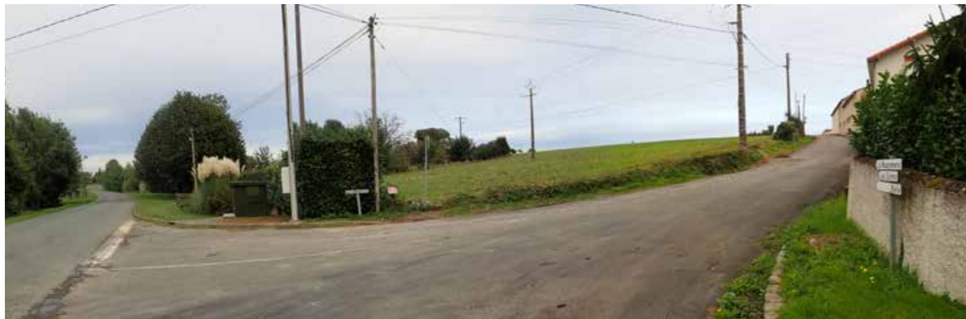
PHOTO 98 : DEPUIS LA RD 103 TRAVERSANT LE BOURG DE MONTIGNÉ, LE REGARD BUTTE SUR LE VERSANT DE LA VALLÉE DE LA BELLE ; LES PERCEPTIONS EN DIRECTION DE LA ZIP SONT TRONQUÉES PAR LE RELIEF, LA VÉGÉTATION ET LA TRAME BÂTIE