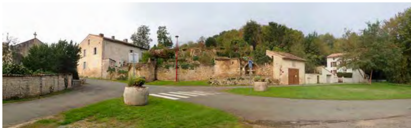
PHOTO 109 : DEPUIS LE CENTRE-BOURG DE SAINT-ROMANS-LÈS-MELLE, LES VUES EN DIRECTION DE LA ZIP SONT FERMÉES SUR DE PETITES PORTIONS PAR LE RELIEF DE LA VALLÉE DE LA BÉRONNE