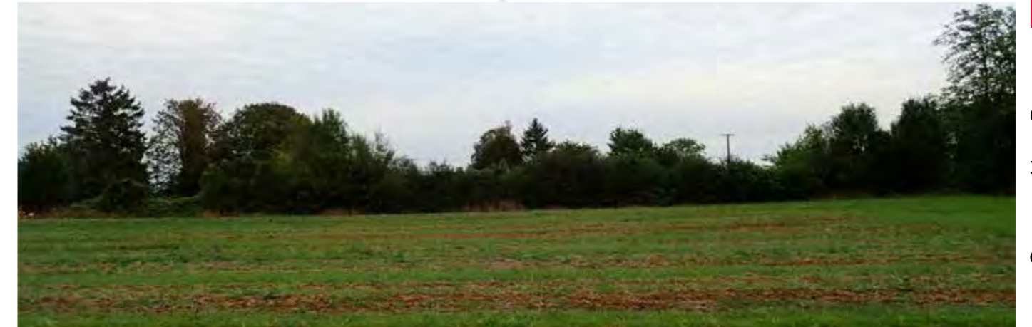
PHOTO 106 : LES HAIES BOCAGÈRES SUR LA FRANGE SUD DU LUC TRONQUENT LES PERCEPTIONS DE LA ZIP