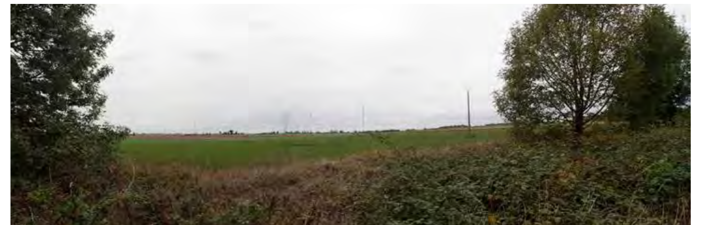
PHOTO 116 : DEPUIS LA FRANGE EST DE VILAINE, LES VUES SONT OUVERTES EN DIRECTION DE LA ZIP ; ELLES PEUVENT PARFOIS ÊTRE FILTRÉES PAR LES ARBRES PRÉSENTS AU PREMIER-PLAN