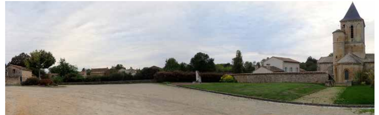
PHOTO 102 : DEPUIS LE CENTRE-BOURG DE VERRINES-SOUS-CELLES, LES VUES EN DIRECTION DE LA ZIP SONT TRONQUÉES PAR LA VÉGÉTATION ET LA TRAME BÂTIE