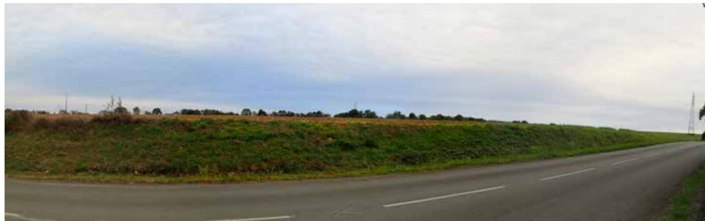
PHOTO 101 : DEPUIS LA RD 103, LES VUES EN DIRECTION DE LA ZIP SONT TRONQUÉES PAR LE RELIEF ET LES HAIES