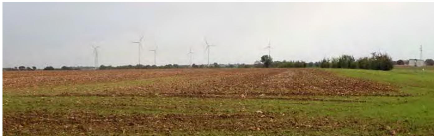
PHOTO 108 : DEPUIS LA FRANGE NORD DE SAINT-ROMANS-LÈS-MELLE, LES VUES EN DIRECTION DE LA ZIP SONT OUVERTES