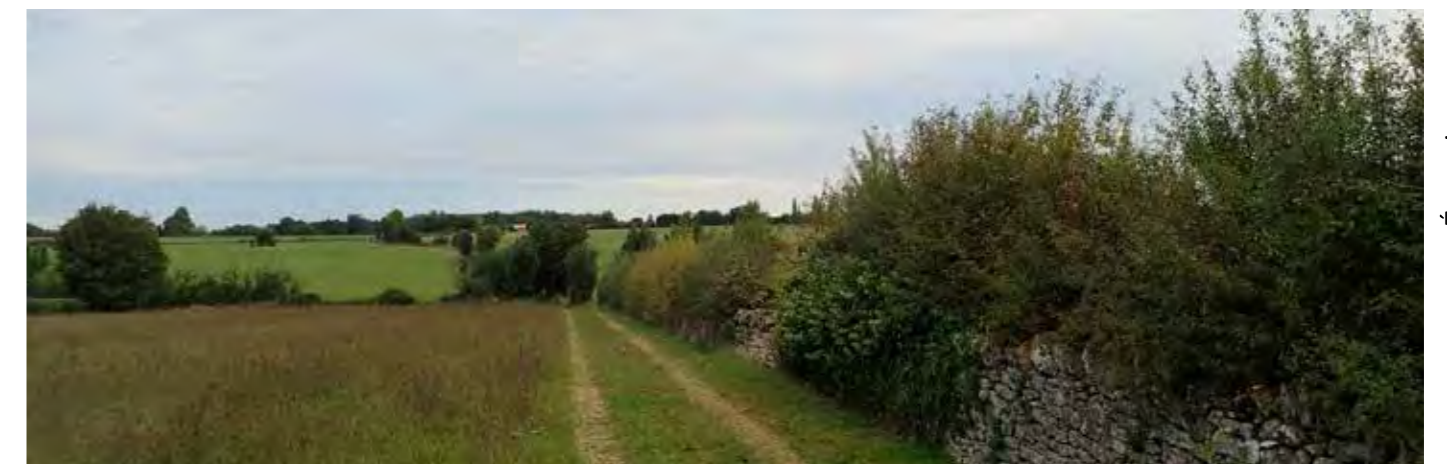
PHOTO 107 : DEPUIS LA FRANGE EST DU LUC LE RELIEF EST LISIBLE ET LES VUES EN DIRECTION DE LA ZIP SONT OUVERTES, TRONQUÉES PAR LA VÉGÉTATION BORDANT LES CHAMPS