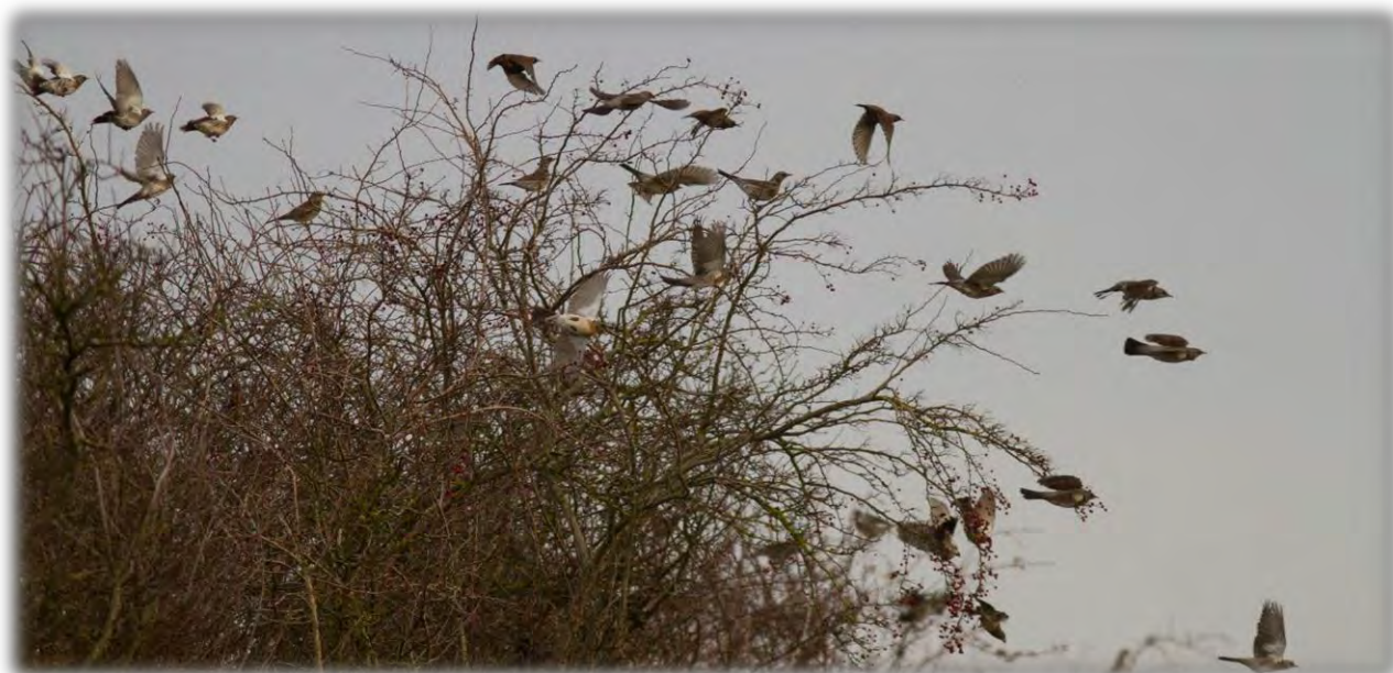
Figure 30 : Grives litornes (janvier 2019)

Le site de Périgné présente un fort potentiel d'accueil pour l'avifaune de plaine, notamment le Pluvier doré et le Vanneau huppé, mais aussi pour les passereaux des milieux semi-ouverts comme les grives (voir photo ci-dessous).