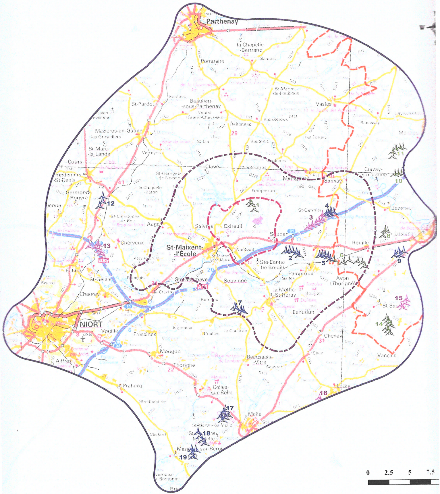
Agglomération de Niort (79) Carte d'Autorisation Environnementale