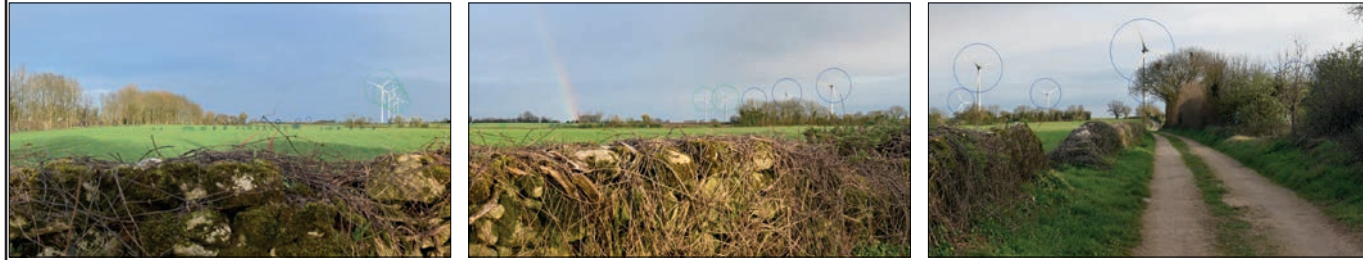
3 - SITUATION EXISTANTE - (O Sélecteur visible O Sélecteur invisible) - Vue 3x40°