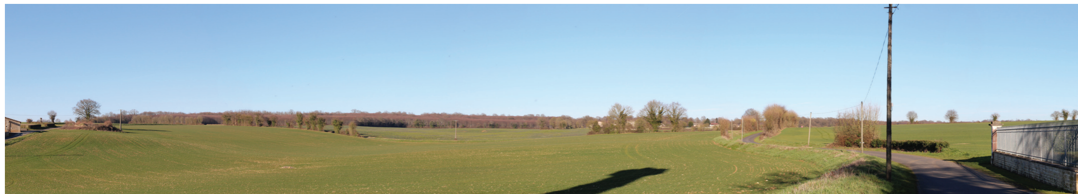
Vue panoramique de l'état initial (angle de vue 120°)