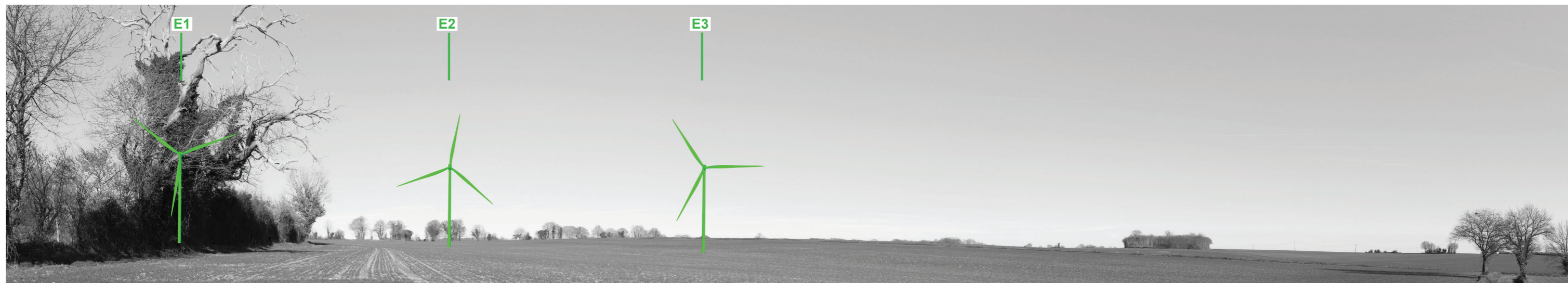
Vue panoramique noir et blanc avec esquisse du projet (angle de vue 120°)

Coordonnées Lambert II étendu : 413664,1 / 2139568,7 Date et heure de la prise de vue : 15/02/2019 à 17:29 Focale : 52 mm, équivalent 24 x 36 Azimut vue réaliste : 50° Angle visuel du parc : 40,2° Eolienne la plus proche : E1, à 901 m