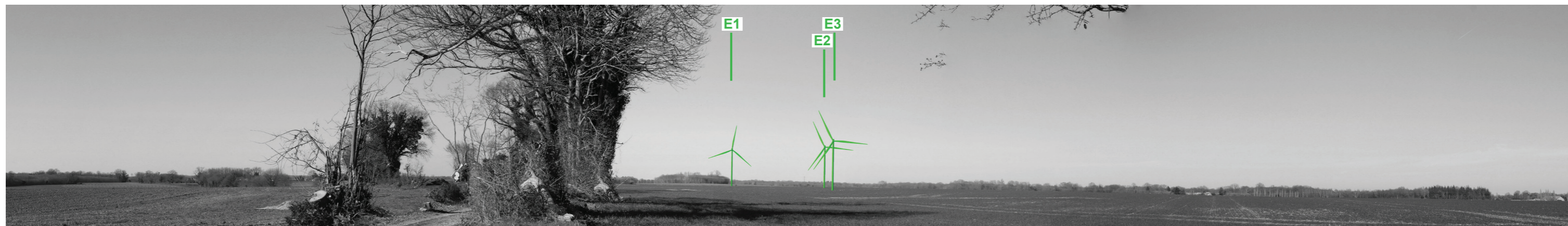
Vue panoramique noir et blanc avec esquisse du projet (angle de vue 120°)

Coordonnées Lambert II étendu : 141917,9 / 2138306 Date et heure de la prise de vue : 15/02/2019 à 15:59 Focale : 52 mm, équivalent 24 x 36 Azimut vue réaliste : 344° Angle visuel du parc : 7,6° Eolienne la plus proche : E3, à 1 611 m