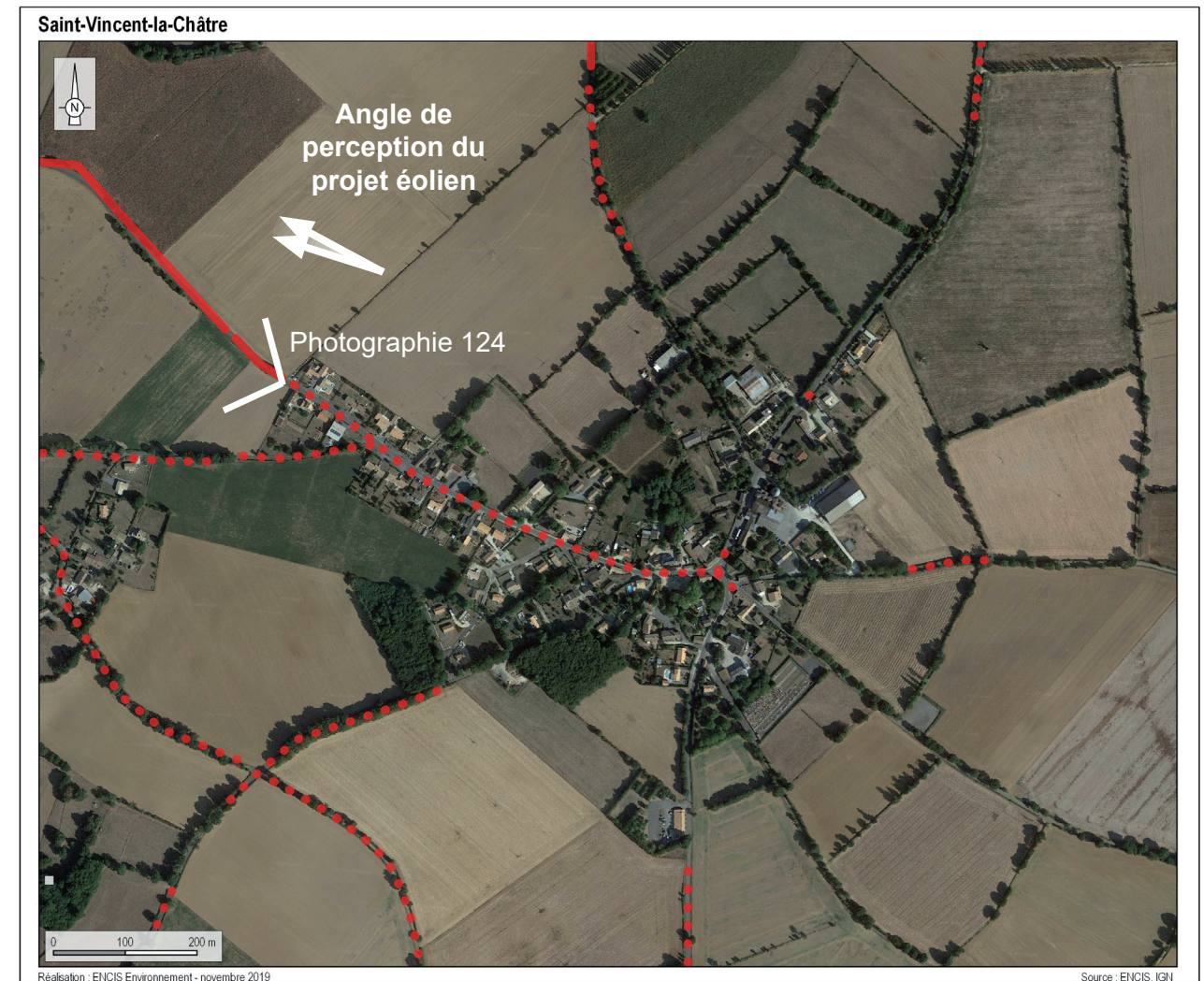
Carte 56 : Vue aérienne et secteurs de visibilité (en rouge) du bourg de Saint-Vincent-la-Châtre (source : Géoportail).

Depuis le centre bourg, les visibilitées sont généralement masquées par la trame végétale ainsi que par le bâti. Le tracé de la D305 est dans l'axe du projet éolien et les espacements du bâti permettent généralement de percevoir le projet. La sortie ouest du bourg offre une vue panoramique en direction du projet (Vue 37 du carnet de photomontages). Malgré la proximité du village avec le projet éolien (compris entre deux et trois kilomètres), le caractère ponctuel et discontinu des visibilitées amène à qualifier un impact faible.