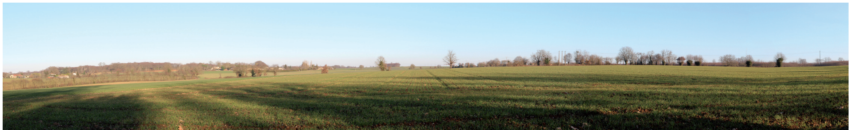
Photographie 85 : Vue de l'état actuel du paysage.