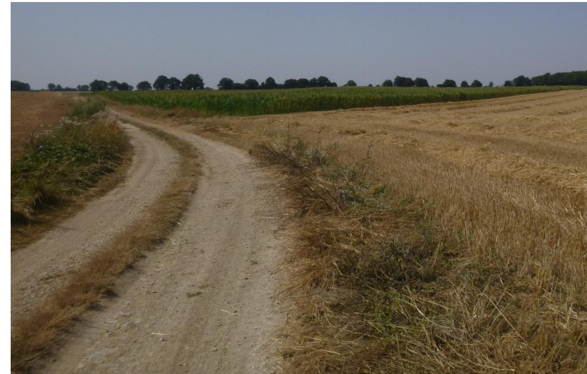
Figure 103 : Chemin à renforcer menant aux éoliennes E2 et E3