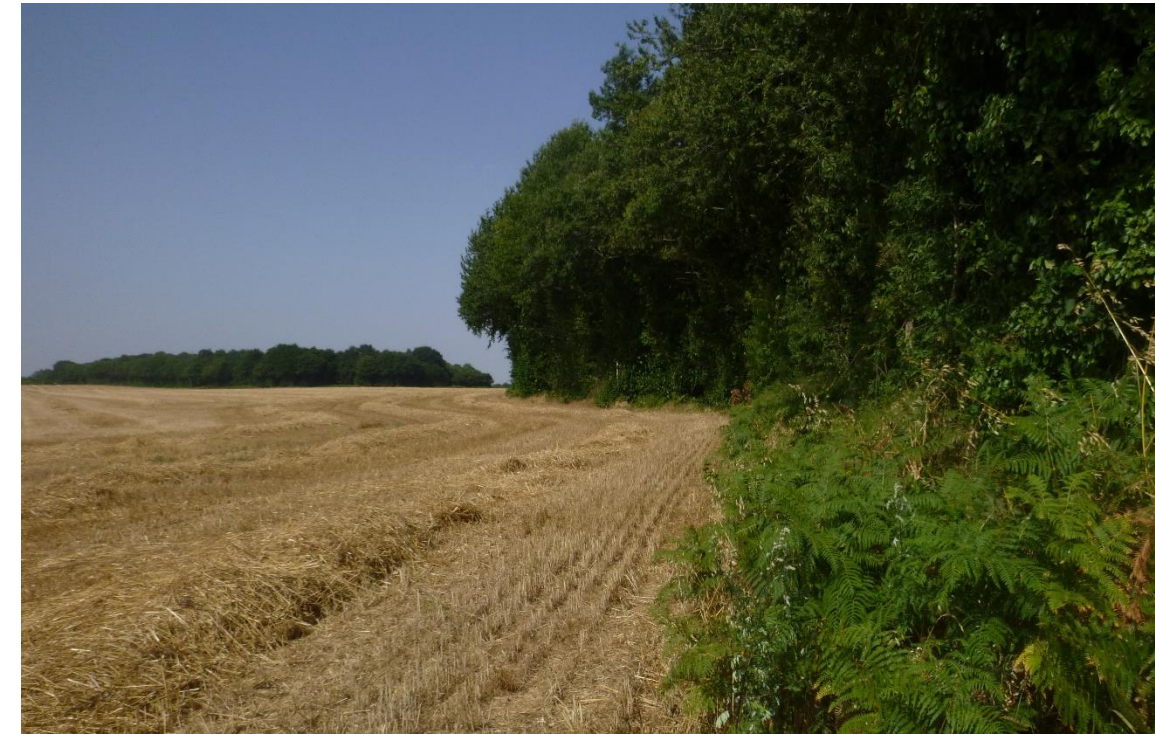
Figure 102 : Culture et lisière de zone boisée - emprise de la plateforme du poste de livraison et du chemin d'accès vers l'éolienne E1.